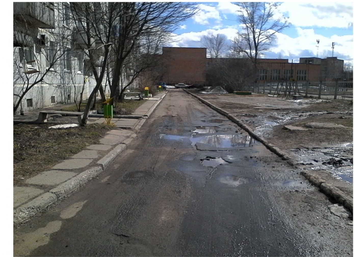
Покрытие проезда после выполнения работ