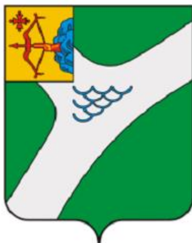
СХЕМА ТЕПЛОСНАБЖЕНИЯ МУНИЦИПАЛЬНОГО ОБРАЗОВАНИЯ «ГОРОД КИРОВО-ЧЕПЕЦК» НА ПЕРИОД ДО 2033 ГГ. (АКТУАЛИЗАЦИЯ НА 2023 Г.)